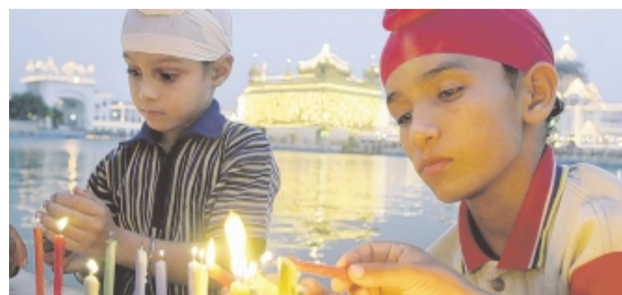
Auf uns fremde Traditionen stoßen Indien-Besucher ständig.